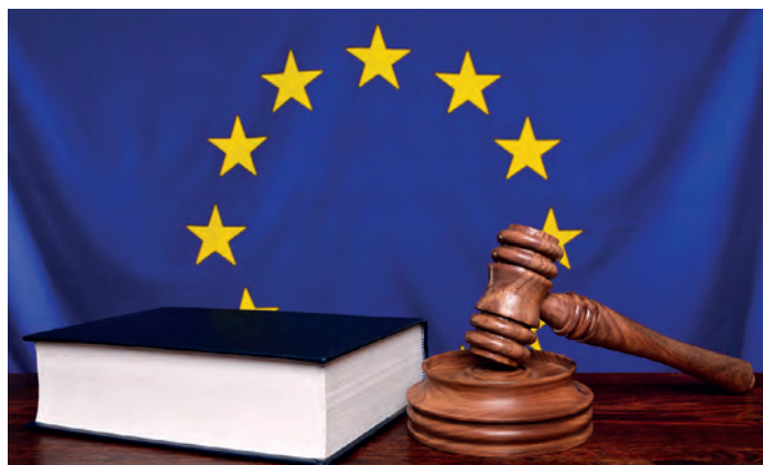
Resultatene fra prosjektet kan danne grunnlag for et nytt EU-direktiv om bedrifters samfunnsansvar.

Prosjektet ble etablert med én finsk og én svensk partner. På grunn av stor interesse for prosjektet, vokste prosjektgruppen