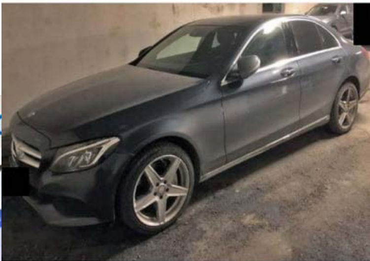
I BESLAG: Politiet har tatt beslag i flere biler under etterforskningen av saken, blant annet en Mercedes og en Audi.