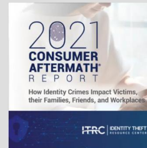
2021 | Identity Theft: The Aftermath Study