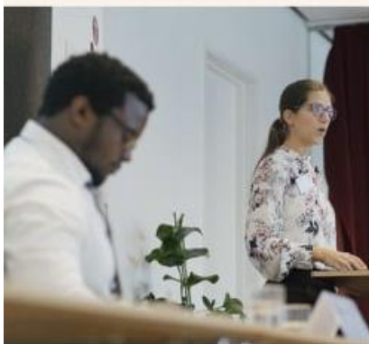
KRITISK: – Slike saker viser at systemet i København's Universitet/Cecilie Pe

Jusekspert er kritisk til hvordan rettssystemet behandler ofre for identitetstyveri. – Når det allerede ligger en straffesak om ID-tyveri, bør det som hovedregel ikke reises en erstatnings sak mot offeret.