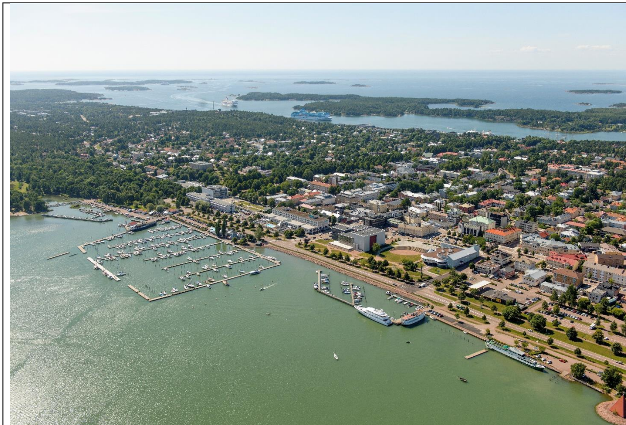
Mariehamn, east harbour